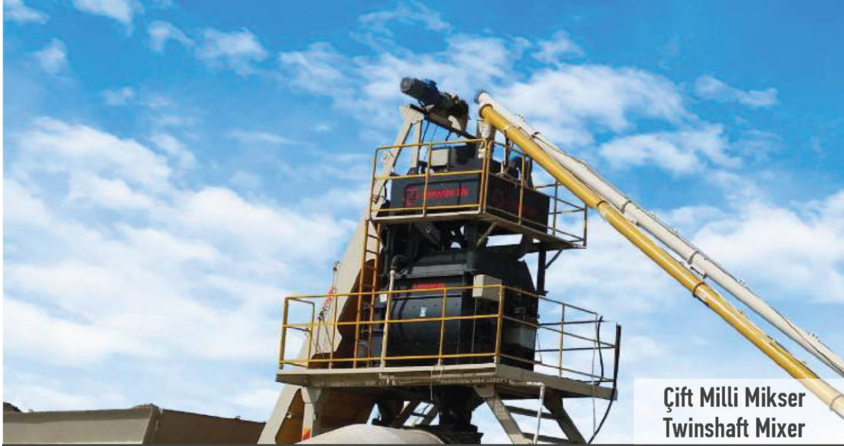
Çift Milli Mikser Twinshaft Mixer